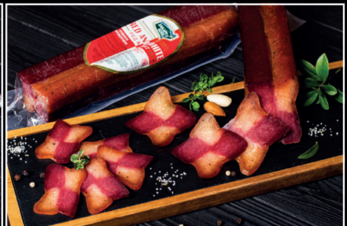
Ред енд Вайт