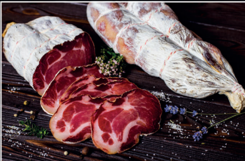
Продукт зі свинини "Коппа" в/с

Строк придатності: 60 діб Температура зберігання: 0 °С...6 °С Упаковка: вакуум