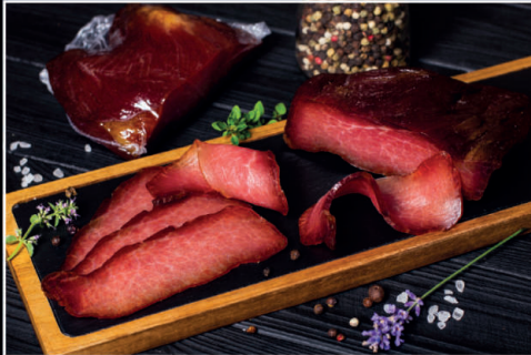
Продукт зі свинини "Шовдар" в/с

Строк придатності: 120 діб Температура зберігання: 0 °С...6 °С Упаковка: вакуум