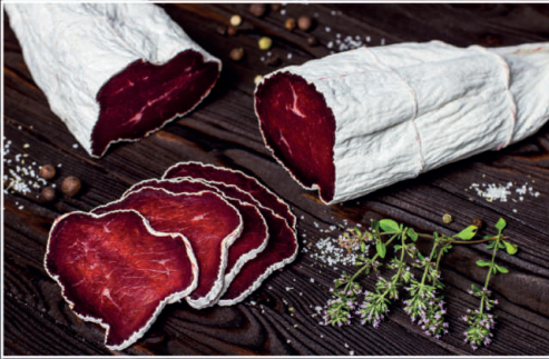
Продукт із ялович. "Брезаола" в/с

Строк придатності: 60 діб Температура зберігання: 0 °С...6 °С Упаковка: вакуум