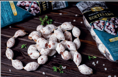
Ковбаски "Коктейльні" в/с

Строк придатності: 180 діб Температура зберігання: 0 °С...6 °С Упаковка: інертн. газ