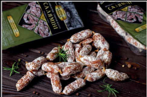
Ковбаски "Саляміні" в/с

Строк придатності: 180 діб Температура зберігання: 0 °С...6 °С Упаковка: інертн. газ